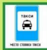
МЕСТО СТАНКИ ТАКСИ