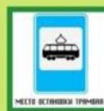
МЕСТО ОСТАНОВКИ ТРОТУАРА