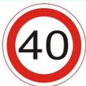
ОГРАНИЧЕНИЕ МАКСИМАЛЬНОЙ СКОРОСТИ