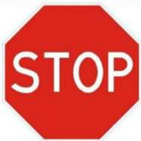
ДВИЖЕНИЕ БЕЗ ОСТАНОВКИ ЗАПРЕЩЕНО