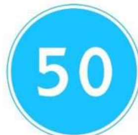
ОГРАНИЧЕНИЕ МИНИМАЛЬНОЙ СКОРОСТИ