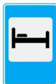
ГОСТИНИЦА ИЛИ МОТЕЛЬ