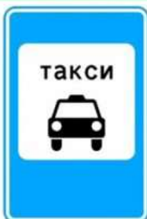
МЕСТО СТОЯНКИ ТАКСИ