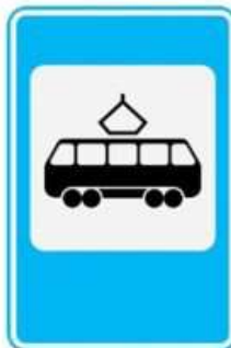
МЕСТО ОСТАНОВКИ ТРАМВАЯ