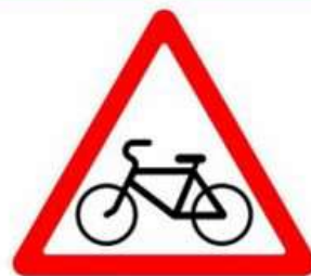
ПЕРЕСЕЧЕНИЕ С ВЕЛОСИПЕДНОЙ ДОРОЖКОЙ