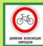
Движение велосипедов ЗАПРЕЩЕНО