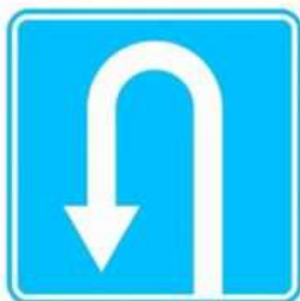
МЕСТО ДЛЯ РАЗВОРОТА