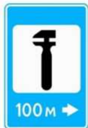
ТЕХНИЧЕСКОЕ ОБСЛУЖИВАНИЕ АВТОМОБИЛЕЙ