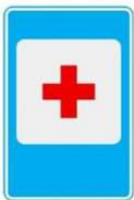
ПУНКТ ПЕРВОЙ МЕДИЦИНСКОЙ ПОМОЩИ