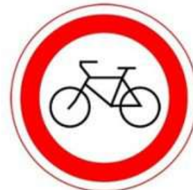
ДВИЖЕНИЕ ВЕЛОСИПЕДОВ ЗАПРЕЩЕНО