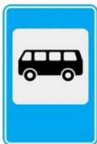
МЕСТО ОСТАНОВКИ АВТОБУСА ИЛИ ТРОЛЛЕЙБУСА